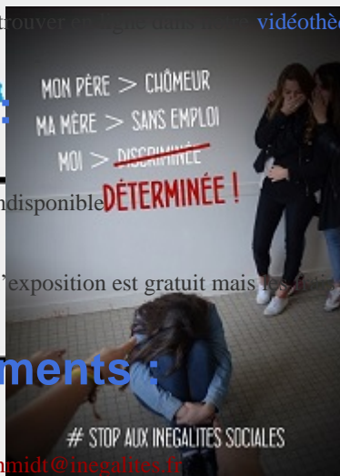
Illustration : affiche « Je ne serai pas femme de » réalisée par Dounia et Badis Saoud, dans le cadre du Prix « Jeunesse pour l'égalité » 2015.